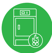
KOTEL NA BIOMASU