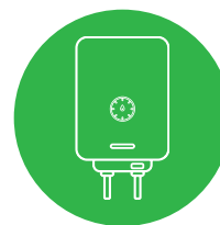
PLYNOVÝ KONDEZAČNÍ KOTEL*